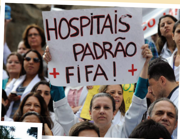
Médicos protestam por melhorias na saúde