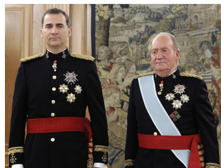
O Rei Juan Carlos da Espanha abdica em favor de seu filho Felipe

Juan Carlos fortaleceu a democracia na Espanha? Certamente, dando estabilidade à Nação. Na Espanha houve alternância de partidos no poder com naturalidade. No Brasil, durante o II Reinado, foram 49 anos em que as eleições se realizavam religiosamente de acordo com o calendário eleitoral. Não houve nenhum golpe de estado, estado de sítio ou suspensão dos direitos individuais dos cidadãos. Graças à monarquia é possível haver uma democracia autêntica, sem essas disputas contínuas que há nas repúblicas, onde os candidatos vivem se digladiando.