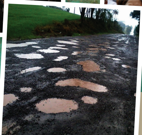
Estado lastimável das estradas brasileiras elevam o custo Brasil