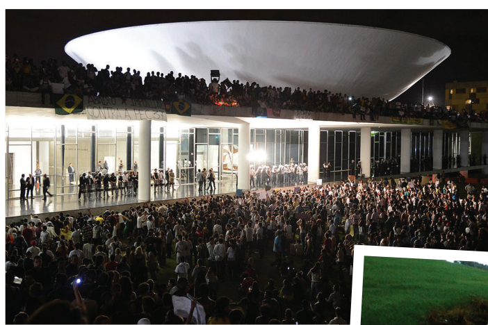
Manifestantes ocupam o Congresso Nacional

Como dissemos acima, a lista de mazelas criadas por maus dirigentes nos cento e tantos anos de república é interminável e impossível de ser relacionada neste exíguo espaço. Precisamos urgentemente de um choque de moralidade, ética e racionalidade, que uma Restauração monárquica poderia estabelecer com naturalidade. Assim como o Grito do Ipiranga deu início a uma nova nação, assim também o descontentamento das ruas está criando as condições para que tenhamos em breve um Novo Brasil.