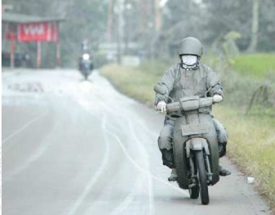
MENERJANG DEBU: Seorang pengendara sepeda motor di Sidorejo, Klaten, berusaha menerobos hujan abu vulkanik Merapi, kemarin.