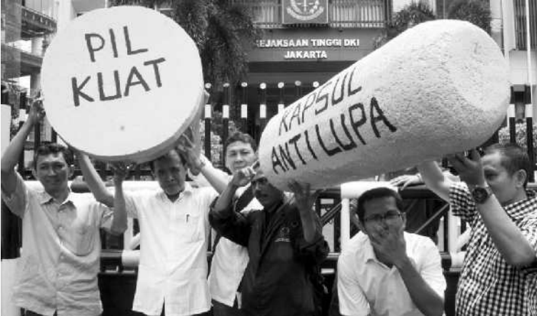
KADO PIL: Aktifis ICW bersama orang tua murid SDN RSB1 012 Rawamangun saat menyerahkan replika pil kuat dan kapsul anti lupa ke Kejati DKI Jakarta, kemarin.