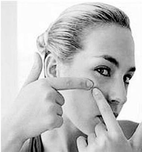
Seorang wanita tengah memencet jerawat yang bersarang di mukanya.

Terakhir, rajinlah berolahraga. Dengan aktivitas badan yang teratur, bisa membuat peredaran darah lancar. Darah yang sehat membuat kulit sehat. ■ UZI