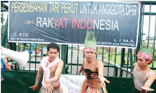
INI PERUTKU: Sejumlah aktivis melakukan aksi teatral tari perut di depan gedung DPR, kemarin. Tari perut itu untuk menyindir kelakuan anggota Dewan yang nekat ke luar negeri meski diprotes masyarakat.

INDONESIA tengah berduka. Tapi kelakuan anggota DPR makin nggak keruan saja. Contohnya delapan anggota BK DPR yang studi banding ke Yunani. Pulang dari Negeri Dewa Dewi ini, mereka malah menyempatkan diri mampir ke Turki dan berwisata.