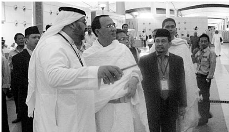
DIBERI ARAHAN: Menteri Agama Suryadharma Ali selaku Amirul Haj, saat meninjau jemaah haji di Terminal Hajj Bandara King Abdul Aziz, Jeddah, Saudi Arabia, Selasa (2/11) malam, memperoleh penjelasan dari salah seorang anggota muasassah Asia Tenggara.

Pertanyaannya, jika jumlah penawar dengan harga di atas Rp1.000 jauh lebih banyak, mengapa diplot Rp 850 per lot. "Indikasi permainan ini harus diungkap Bapepam se jelas-jelasnya," pungkasnya. ■DIT/MAF