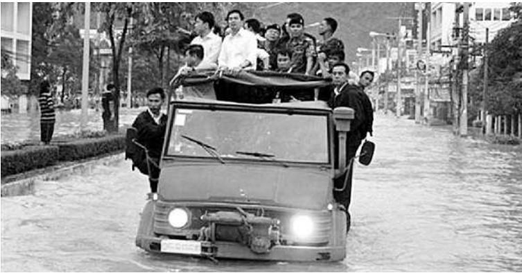
TEROBOS BANJIR. PM Thailand Abhisit Vejjajiva melakukan inspeksi di kawasan banjir di distrik Yai di Provinsi Songkhla, Thailand. Departemen Pencegahan Bencana dan Mitigasi Thailand, kemarin, menyatakan, 122 orang tewas akibat banjir di seluruh Negeri Gajah Putih. Sebanyak 39 provinsi di wilayah utara, timur laut, timur dan tengah Thailand dilanda banjir dan tanah longsor. Kerugian diperkirakan mencapai 54,2 miliar baht atau 1,8 miliar dolar AS.

Hukum Romania memungkinkan anak perempuan untuk menikah pada usia 16 dengan izin orang tua, atau di usia 18 tahun tanpa izin orangtua. ■ AP/RCF