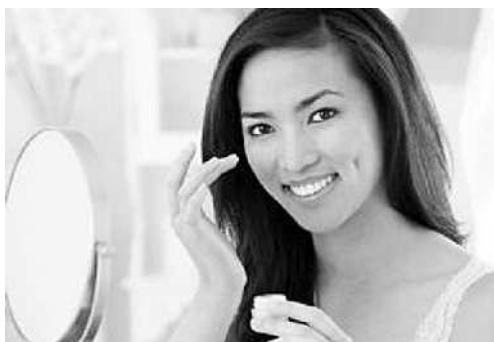
Pemakaian krim pemutih bisa mengganggu kesehatan kulit wajah.

Ia berharap, produk tersebut mampu memenuhi kebutuhan para remaja agar kulit wajah tetap sehat dan segar. Tissue ini cocok digunakan sebelum tidur, praktis dipakai sehabis olahraga dan cocok untuk pengendara motor yang acap kali kena debu jalanan dan asap kendaraan. ■ UZI