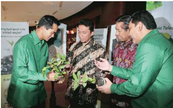
INDRA HARDIR AKYAT MERDEKA

Berdasarkan pengakuan salah satu pejabat Lotte Group, raksasa ritel asal Korea Selatan itu akan membeli saham MPPA dari PT Star Pacific Tbk (LPLI) sebanyak 338.419.625 saham atau 6,30 persen. Harga yang ditawarkan di