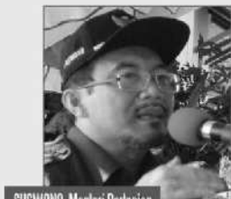
SUSWONO, Menteri Pertanian