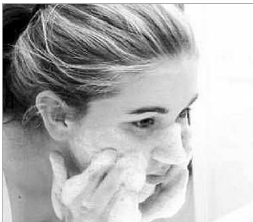
Cuci muka bisa menghindari terjadinya jerawat.

Selain itu, kurangi makanan berlemak tinggi. Perbanyaklah makanan sayuran atau buah-buahan. Terutama, buah-buahan yang mengandung vitamin C.