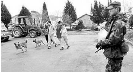
Tentara Korsel berpatroli di zona damai antara Korut dan Korsel.

KOREA Selatan (Korsel) memasang jendela anti-peluru pada observatorium di desa perbatasan untuk mencegah wisatawan menjadi korban tembakan Korea Utara (Korut). Tiga jendela anti-peluru dipasang di paviliun observatorium di desa Daeseongdong, di dalam Zona Demilitarisasi (DMZ) yang membelah Semenanjung Korea. Daeseongdong, berpenduduk 200 orang, hanya 800 meter dari pos penjagaan Korut dalam DMZ.